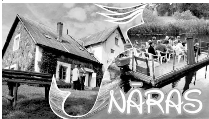
krogs / pirts / viesnīca / plosts «Ruhjas Donalds»

Nākamajā numurā uz jautājumiem atbild domes priekšsēdētāja vietnieks, novada komunālās saimniecības vadītājs Egils Tenters.